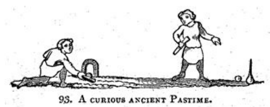
1. kép. „Ball yard”, a biliárd őse 3

Kialakulásához ugyancsak többféle legenda fűződik, de az bizonyos, hogy egy olyan középkori szabadtéri, golyókkal folytatott játékból fejlődött ki, amelynek során egy kis fűves pályán a földre függőlegesen elhelyezett karikába kellett valamilyen ütőszerszámmal bemozgatni a golyókat. Egyes források szerint ez volt az a játék, amelyet a XVIII. századi Angliában „ball jard” néven ismertek. 2