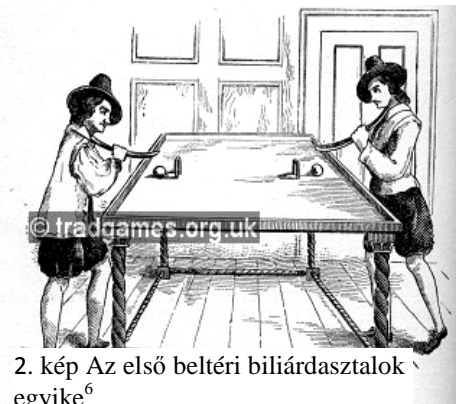
2. kép Az első beltéri biliárdasztalok egyike 6

időben a játék nehezebbé és érdekesebbé tétele érdekében az asztalra különböző akadályokat, például kapukat, tekebábut tettek 5